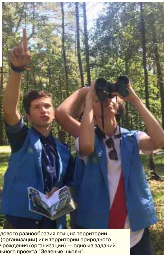
Изучение видового разнообразия птиц на территории учреждения (организации) или территории природного окружения учреждения (организации) — одно из заданий образовательного проекта “Зеленые школы”.