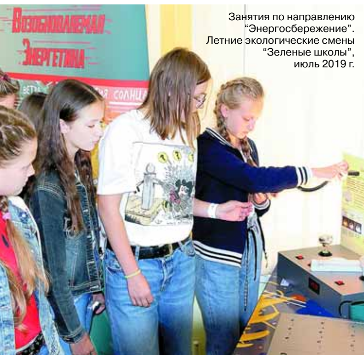
Занятия по направлению “Энергосбережение”. Летние экологические смены “Зеленые школы”, июль 2019 г.

Образовательный проект “Зеленые школы” набирает все большую популярность в нашей стране. И это правильно, так как сегодня молодое поколение становится проводником экологической информации. Все больше учреждений образования в Республике Беларусь присоединяется к сети “зеленых школ”, что послужит началом для присоединения “зеленых школ” Беларуси к международной сети эко-школ.