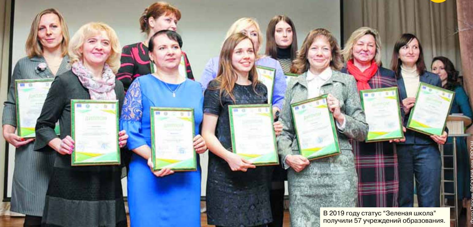
В 2019 году статус “Зеленая школа” получили 57 учреждений образования.