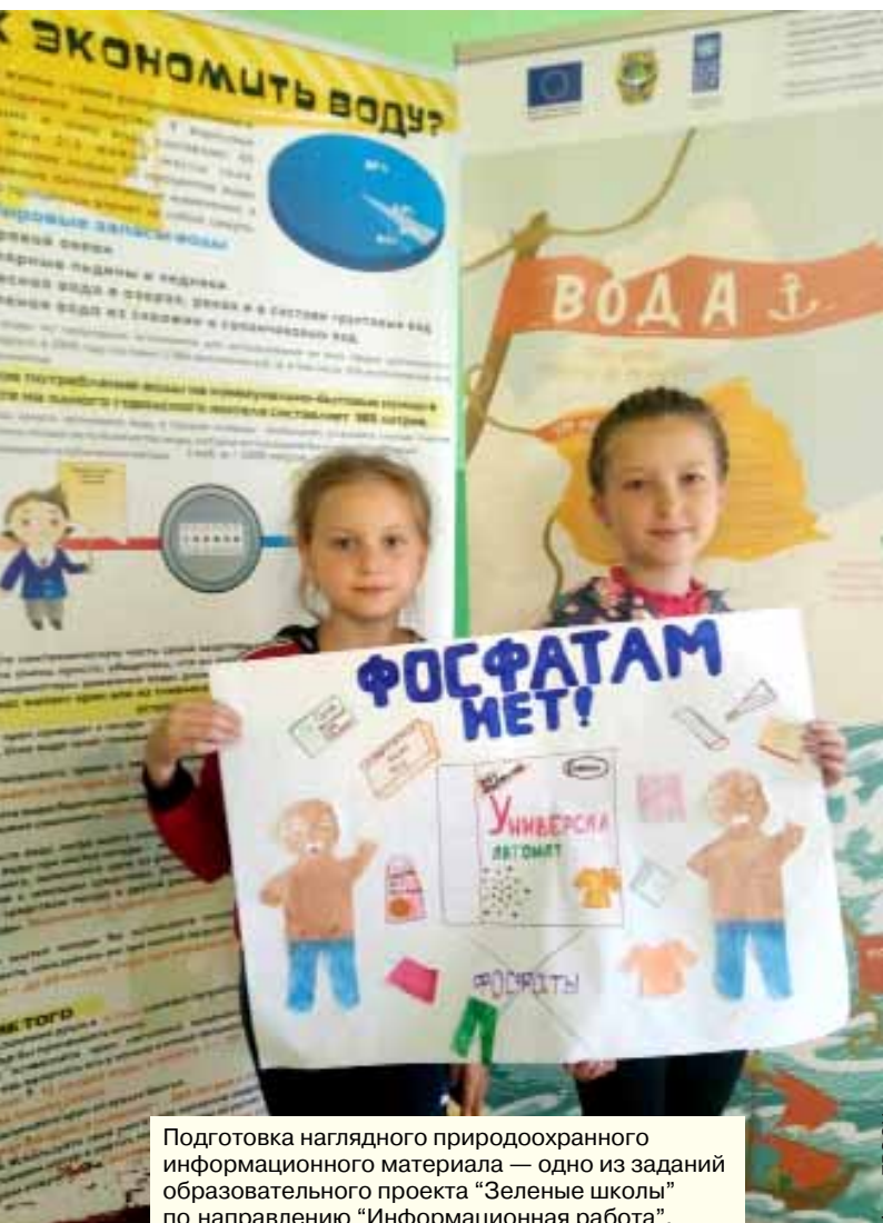
Подготовка наглядного природоохранного информационного материала — одно из заданий образовательного проекта “Зеленые школы” по направлению “Информационная работа”.