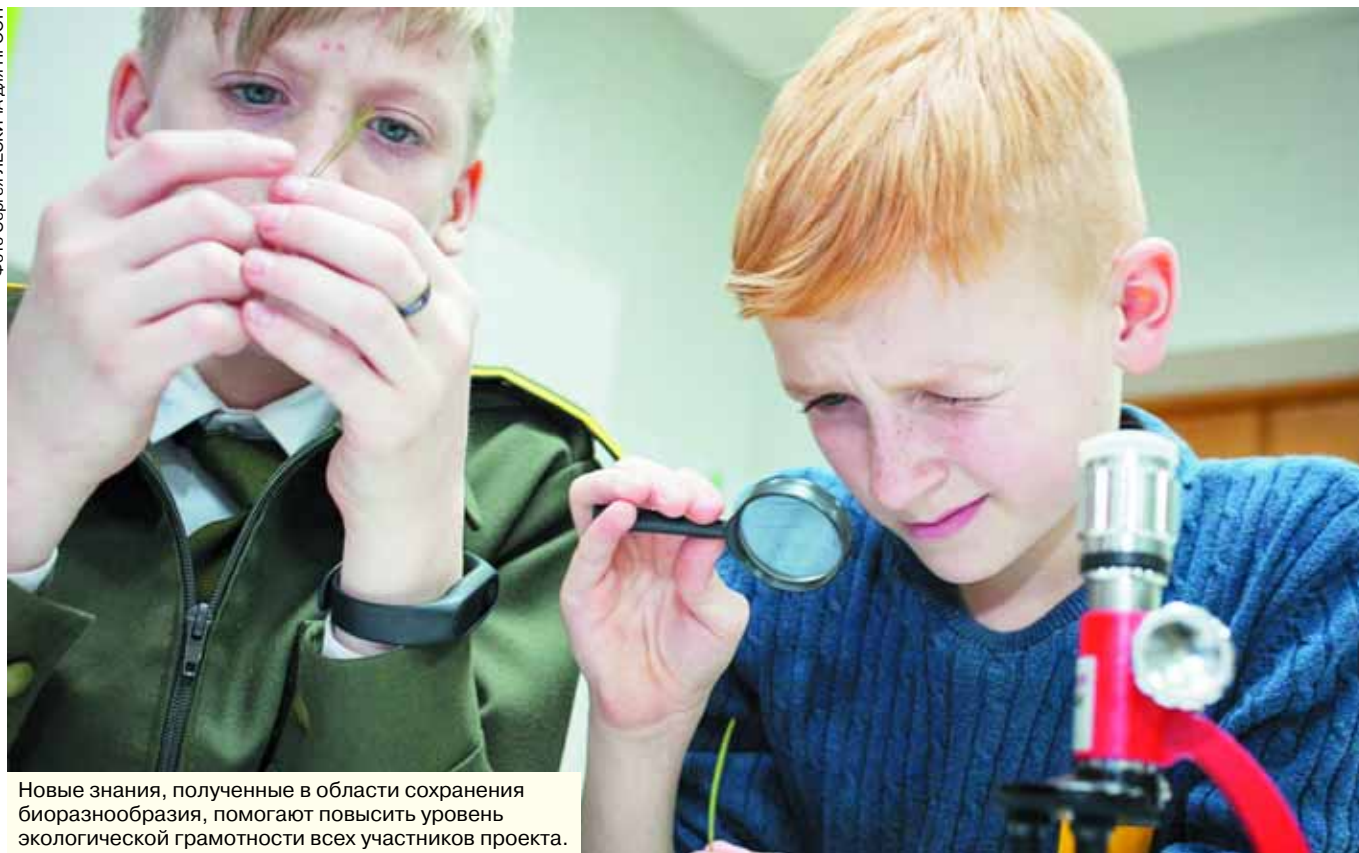
Новые знания, полученные в области сохранения биоразнообразия, помогают повысить уровень экологической грамотности всех участников проекта.