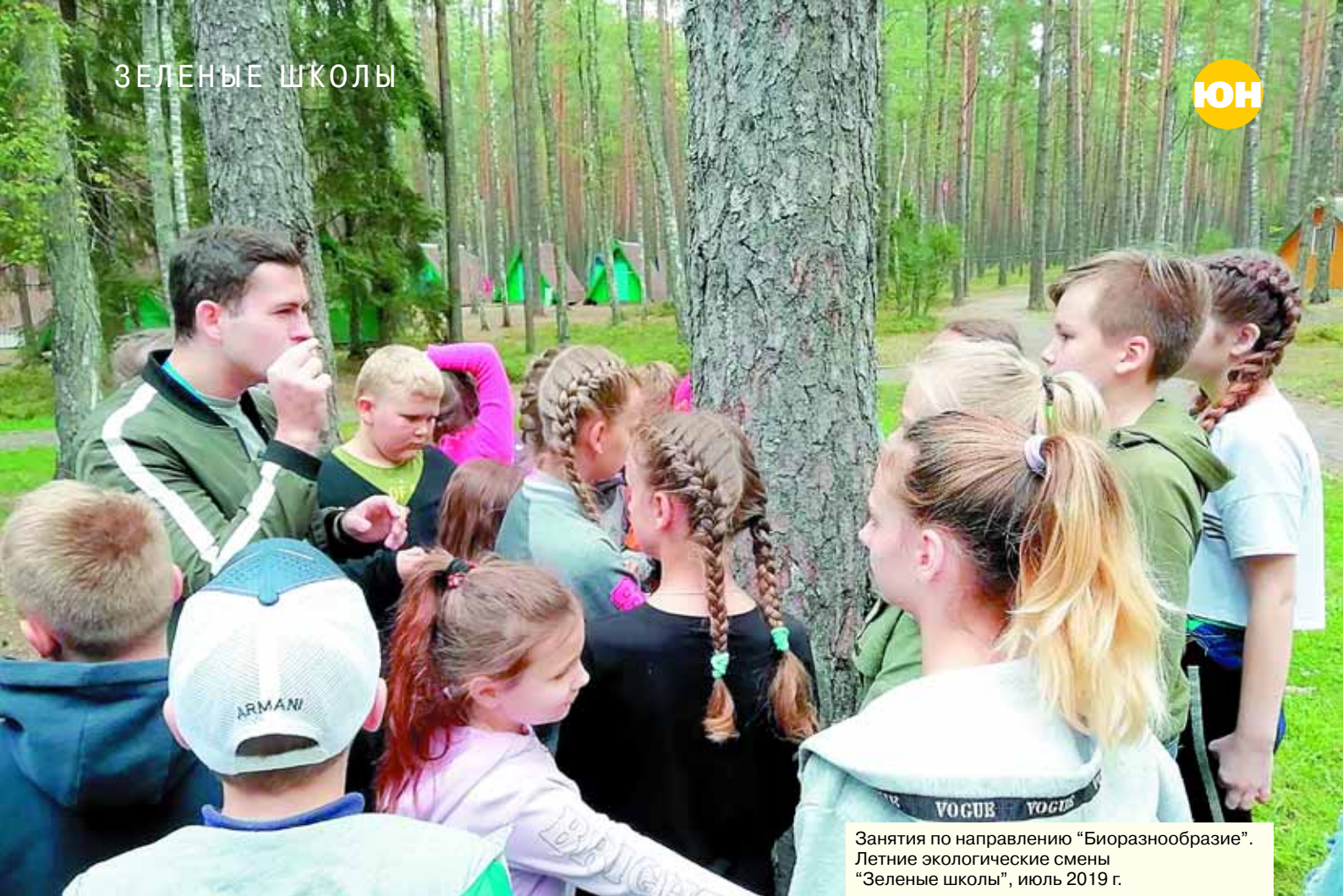
Занятия по направлению “Биоразнообразие”. Летние экологические смены “Зеленые школы”, июль 2019 г.